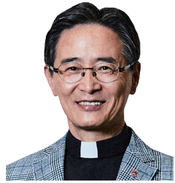
심종혁 총장 서강대학교

서강대학교 미래교육원에서 운영하는 부동산최고전문가과정의 관심과 바쁜 일상 속에서도 ‘배움’을 선택하신 여러분의 결단에 깊이 감사드리며, 존경의 마음을 전합니다.